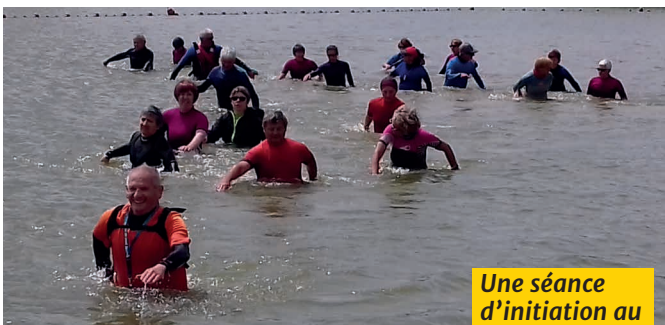
Une séance d'initiation au longue côte