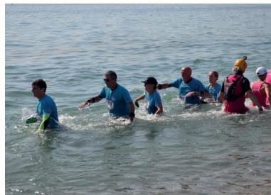
Les longeurs en plein effort